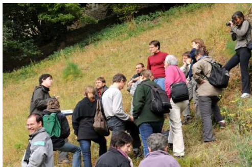
Rencontre commission sur la RN de l'Astoblème de Rochechouart-Chassenon