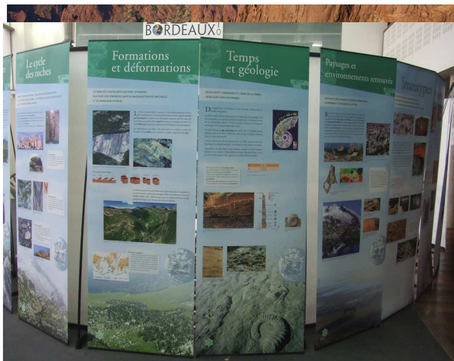
Exposition Mémoire de la Terre