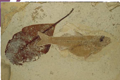
Poisson et feuille fossile, RN du Luberon