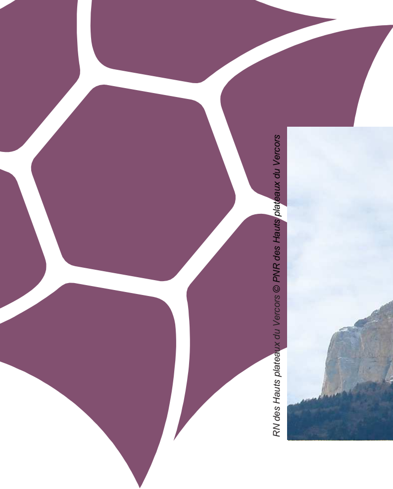
RN des Hauts plateaux du Vercors