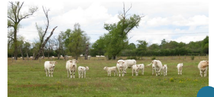
Pâturage sur les prairies ligériennes