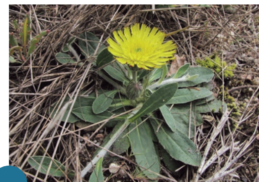
La Piloselle de Loire, espèce endémique

2 110 Grues cendrées ont été comptabilisées en hiver 2016 sur la réserve naturelle contre 46 en 2002.