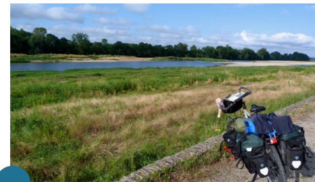
Balade à vélo sur les bords de Loire