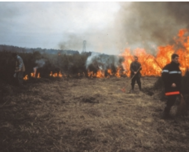
Brûlis dirigé

Le décret de création n° 80-135 du 30 janvier 1980, modifié par le décret n° 80-847 du 23 octobre 1980, régit les activités sur les 135 hectares de la réserve naturelle.