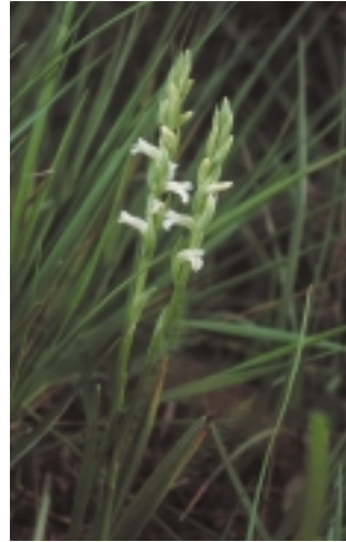
La Spiranthe d'été est une orchidée rarissime en Europe

Sur l'ensemble du Pinail, plus de 450 espèces de plantes supérieures ont été recensées.