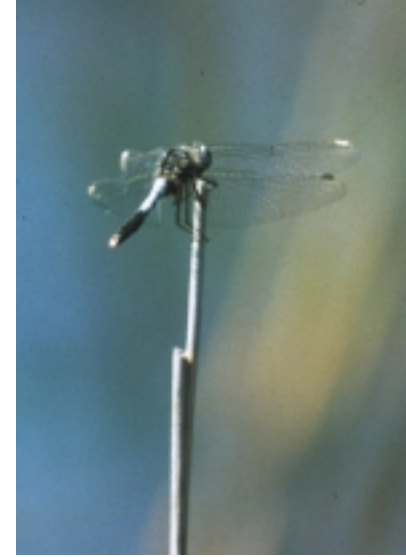
La Leucorrhinie à large queue surveillant son territoire