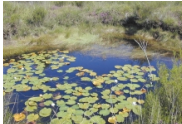
La Lande à Mares