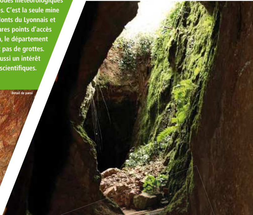
Détail de paroi

La Réserve Naturelle Régionale de la mine du Verdy offre aux chauves-souris un gîte de refuge et de tranquillité pendant l'hibernation et lors de périodes météorologiques défavorables. C'est la seule mine d'importance des Monts du Lyonnais et un des rares points d'accès au milieu souterrain, le département du Rhône n'ayant pas de grottes. Elle présente aussi un intérêt pour les scientifiques.