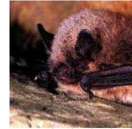
Murin à moustaches