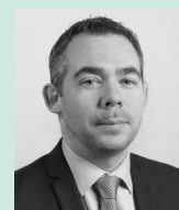
Stéphane WOYNAROSKI Région Bourgogne-Franche-Comté