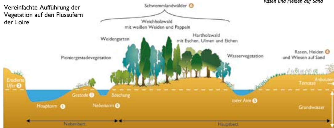
Nach einem Schema von J.-C. Felzines

Vereinfachte Aufführung der Vegetation auf den Flussufern der Loire