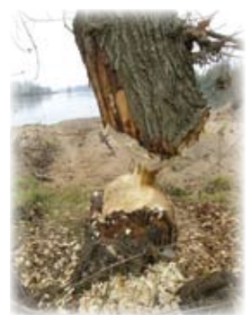
Die wie Bleistiftspitze angespitzten Bäume verraten die Anwesenheit des europäischen Bibers. Früher gejagt, ist er aus unseren Flüssen verschwunden. Dank der angewandten Schutz- und Wiedereinführungsmaßnahmen konnte er sich wieder in seinem früheren Bereich kolonisieren. Er trägt der Pflege der örtlichen Landschaft bei, indem er sich mit Weiden und Pappeln ernährt

Die Seltenheit einiger Lebensräume die einen noch freien Fluss kennzeichnen und der Schutzstatus von zahlreichen Tier- und Pflanzenarten belegen das Vorhandensein einer natürlichen und geschützten Umgebung « Réserve Naturelle du Val de Loire ».