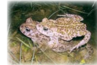
Die Kreuzkröte liebt feuchte und sandige Standorte.

Die toten Arme und die Nebenarme ⑤ können während eines Jahresteils trocken stehen. Wenn es der Wasserpegel erlaubt, kommt der Hecht, um in diesem ruhigen Wasserbereich zu laichen. Im Winter, finden hier zahlreiche Vögel eine Unterkunft.