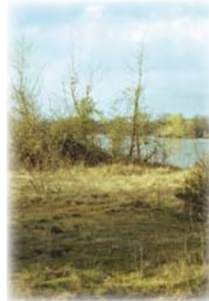
Rasen und Heiden auf Sand

Auf den Sand – und Kiesbänken ③ (Gestade) sind die Lebensbedingungen extrem: Obwohl die Gestade während einem großen Jahresteil unter Wasser steht, kann die Temperatur im Sommer bis zu 50°C steigen und der Boden hält kein Wasser zurück.