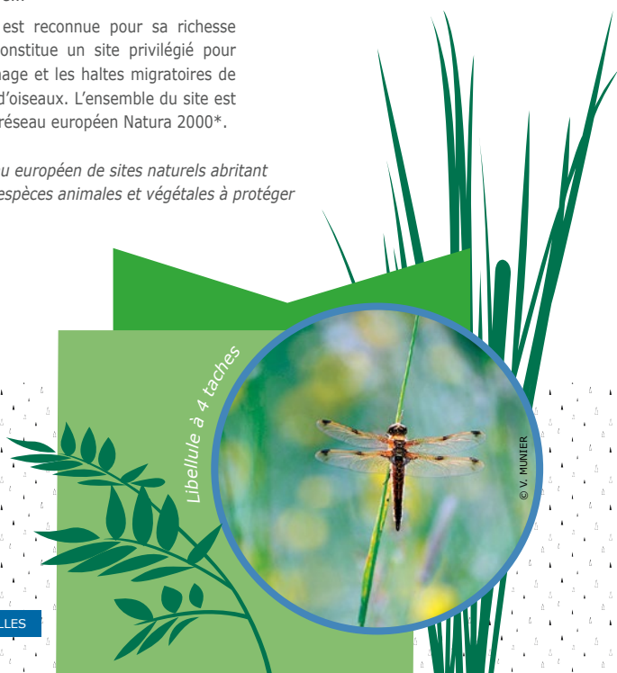
Libellule à 4 taches

Le maintien de cet écosystème dans un bon état de conservation -oiseaux, amphibiens, libellules...- est principalement dépendant du fonctionnement hydrologique de l'étang, et donc de son bassin versant. En effet, la qualité de l'eau alimentant l'étang est tributaire des pratiques agricoles exercées et donc de son bassin versant. Des pratiques agricoles adaptées participent ainsi directement à la préservation de cet écosystème.