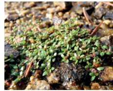
Élatine à six étamines

Créé au Moyen-Age sur le cours de la Borne Occidentale, le lac abrite des gazons amphibies d'une grande rareté ainsi que des herbiers aquatiques.