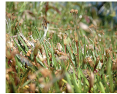
Littorelle à une fleur